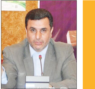
رییس اداره منابع طبیعی و آبخیزداری گرگان: