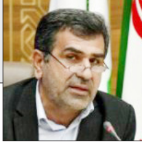
نماینده مردم ساری و میاندورود در مجلس:

قرار داشتن بیش از هزار زوج نابارور مازندران زیر پوشش