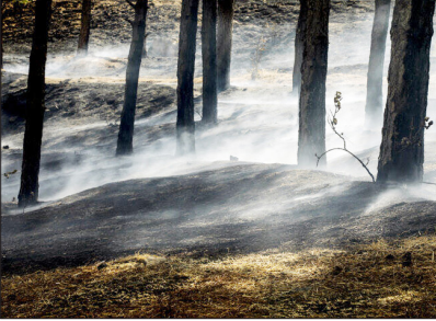
آتش سوزی در پارک ملی گلستان

وی افزود: نشست مدیریت بحران صبح روز پنجشنبه در محل پارک ملی گلستان برگزار شد و در نهایت ۷۵ نیروی تازه نفس متشکل از محیط زیست، منابع طبیعی، مردم مدخلی و بسیج پس از ساماندهی از ساعت هفت صبح جایگزین نیروهای مستقر برای پاکسازی کنده‌ها، شاخه و تنگ‌های نیم سوخته به محدوده حریق اعزام شدند.کنعانی نوع آتش سوزی را از نوع کفسوز اعلام و بیان کرد: بیشترین خسارت این آتش سوزی که طبق برآوردهای اولیه گستره آن حدود پنج هکتار است مربوط به لاشه برگ‌ها و درختان خشک افتاده در کف جنگل می‌شود. وی گفت: در سال‌های اخیر از محل اعتبارات پارک ملی گلستان، وسایل اطفای حریق این پارک را در حد توان مجهز کردیم و سال گذشته هم ۱۰ میلیارد تومان از محل اعتبارات سفر رییس جمهوری برای تقویت لوسازم اطراف حریق سایر مناطق تحت حفاظت اختصاص یافت.مدیرکل حفاظت محیط زیست گلستان افزود: با وجود بهبود تجهیزات اطفای حریق برای مناطق تحت پوشش محیط زیست اما همچنان در