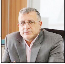
مدیرکل بیمه سلامت مازندران اعلام کرد:

قرار داشتن بیش از هزار زوج نابارور مازندران زیر پوشش