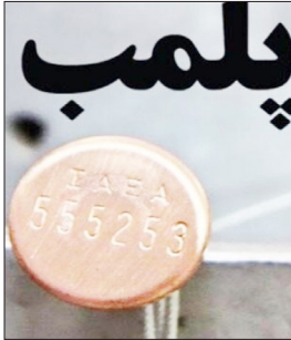
پلمب ۴ واحد متخلف پلمب در راستای اجرای طرح حجاب و عفاف در آزادشهر