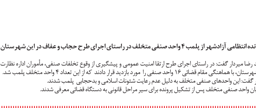
جانشین فرمانده انتظامی آزادشهر از پلمب ۴ واحد صنفی متخلف در راستای اجرای طرح حجاب و عفاف در این شهرستان

زنگانه ادامه داد: با توجه به چالش تامین زمین در استان‌های شمالی در اقدامی جهادی ۱۰۰ درصد زمین مورد نیاز نهضت ملی مسکن در روستاها و زمین مورد نیاز ۲ سال اول مسکن شهری تامین شد و با تقدیر از حمایت‌های ملی، در حوزه اجرای نهضت ملی مسکن