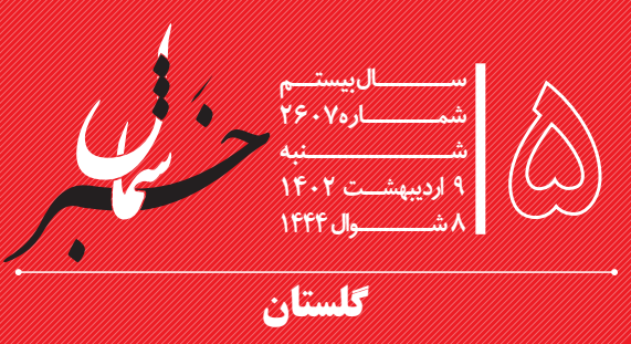
۸شوال ۱۴۴۴ ۹ اردیبهشت ۱۴۰۲ شنبه شماره ۲۶۰۷۲ سال بیستم