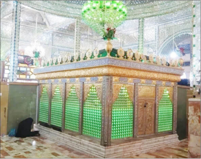
بقعه خواهر امام رضا (ع) در رشت