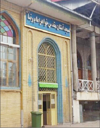
بقعه خواهر امام رضا (ع) در رشت