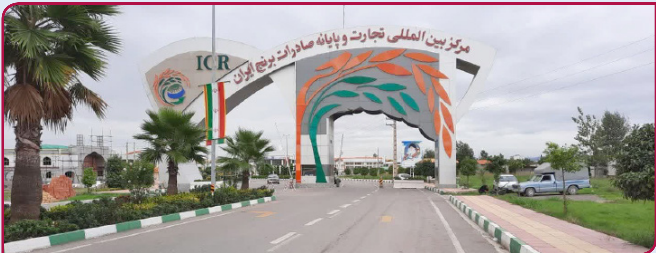
کشاورزان بدون دغدغه پیش بروند.