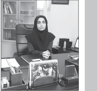
حضور هیئت تجاری منگستانو در گلستان