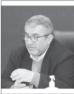
رئیس سازمان جهاد کشاورزی مازندران