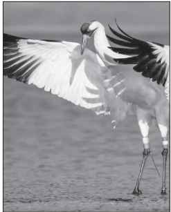
همسفر تنهاترین پرنده جهان