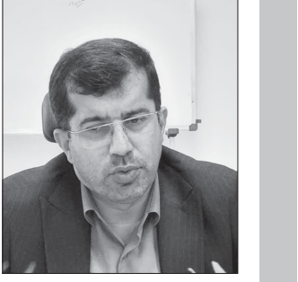
مدیرکل بنیاد مسکن گلستان