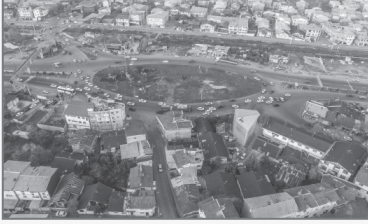
نمای هوایی از تقاطع غیرهمسطح لاهیجان

پروژه تقاطع غیر همسطح لاهیجان (کمربندی لاهیجان) بخشی از بزرگراه آستارا – گرگان که از سال ۹۴ کلید خورد بعد از گذشت هفت سال و تغییر ۲ پیمانکار با حدود ۹۰درصد پیشرفت فیزیکی سرانجام در ایستگاه پایانی قرار گرفته است.